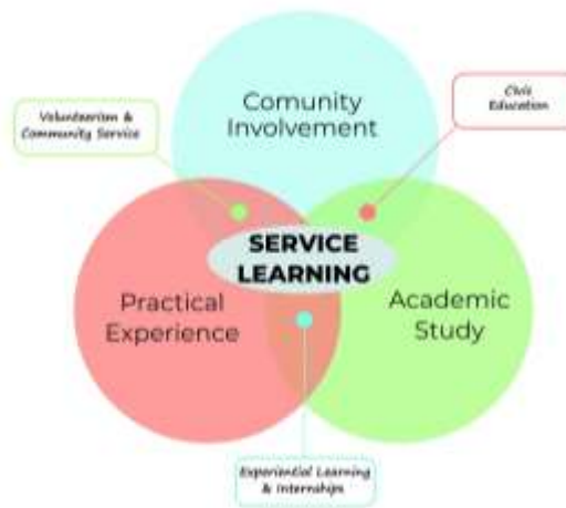
Figura 1. Aprendizaje-Servicio

Para abordar el problema de la pobreza energética se estableció una actuación conjunta entre diferentes escuelas de la UPM, La Fundación Tomillo y el Ayuntamiento de Madrid (Fig. 2).