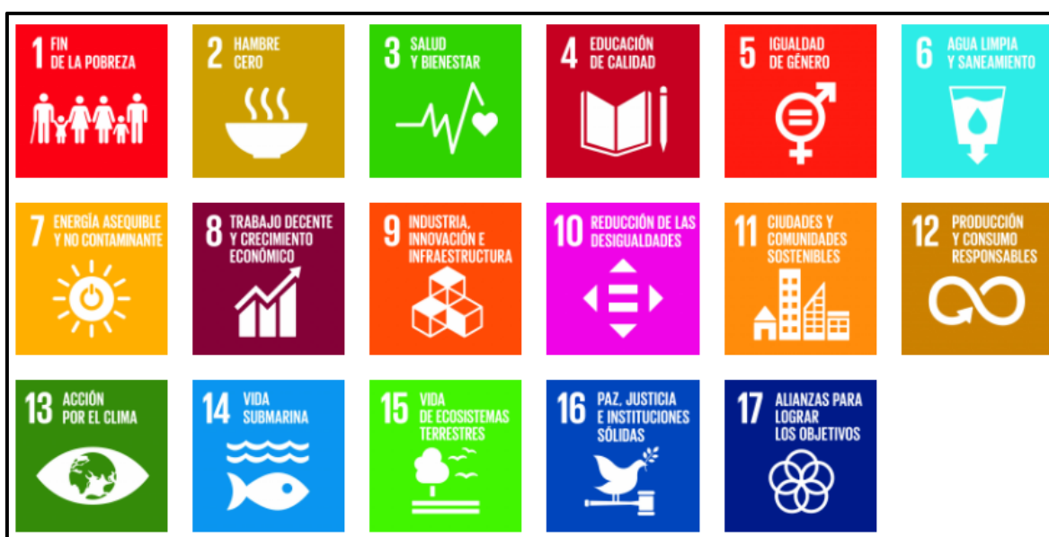
Figura 1: Objetivos de Desarrollo Sostenible

Toda la información relativa a los ODS en la UPM se puede consultar en la página web: https://sostenibilidad.upm.es/