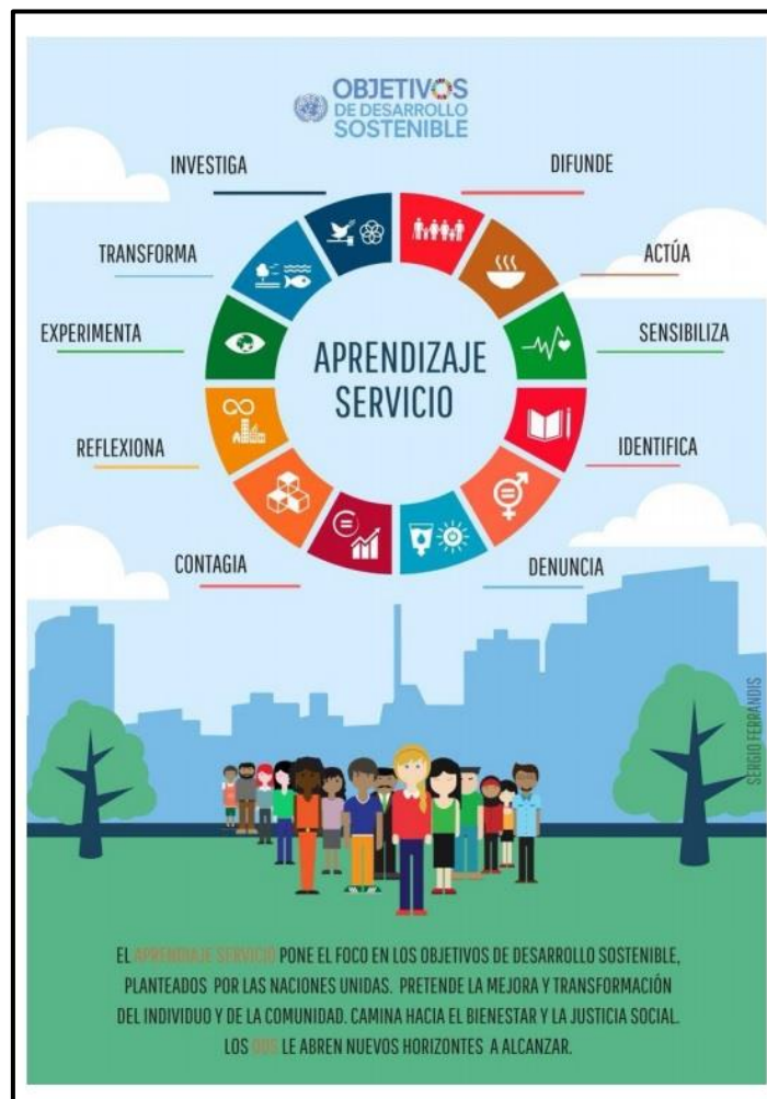
Figura 2: Infograma ApS-ODS (Ferrandis, S. 2019)

Ferrandis (2019), también lo ilustra en el siguiente infograma: