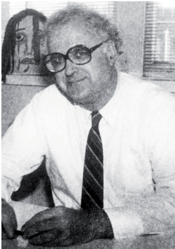
John Hejduk, 1991, Cooper Union's

representación pensamiento/ acción texas rangers five architects docencia cooper union intercambio transgresor gran influencia